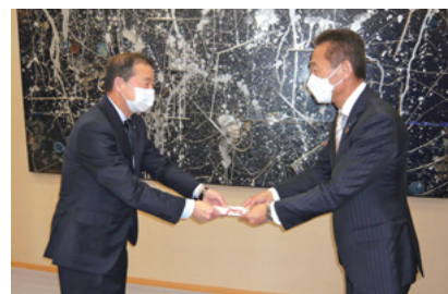
「福井県しあわせ基金」への寄付金贈呈の様子

「ATMの利用促進策」の取り組み結果に基づき地域の福祉活動に役立てていただくよう、富山県善意銀行、北國愛のほほえみ基金、福井県しあわせ基金へ寄付金90万円（各30万円）を贈呈しました。