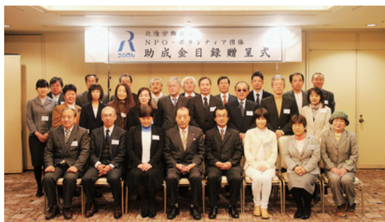
助成金目録贈呈式集合写真