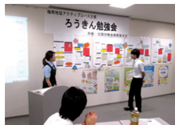
若年層向け研修会