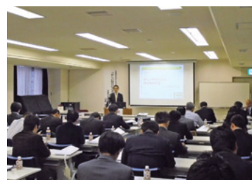
企業年金セミナー