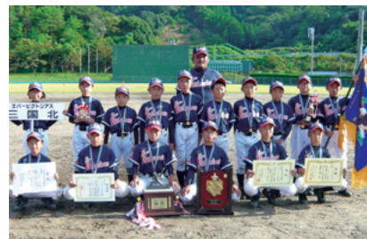
第28回福井県学童野球大会 優勝工バービクトリアス三國北