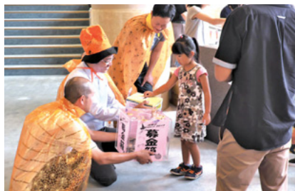
地域交流行事「チャリティー映画上映会」(魚津支店)

このほか、「24時間テレビ38」への協賛により、総額852,666円の募金が結集され、寄付を行いました。