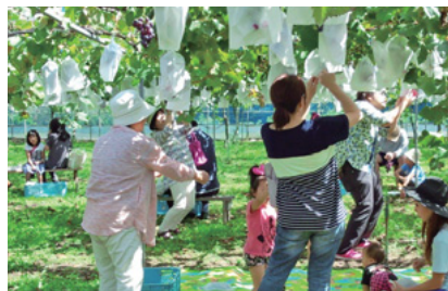
地域交流行事「チャリティーぶどう狩り」(能美支店)