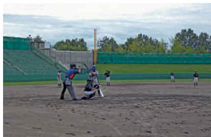
第27回ろうきん旗争奪軟式野球富山県大会

このほか、全店舗での地域交流行事の開催を通じ寄せられた募金額は総額2,010,734円となり、各種団体に寄付を行うことで、地域福祉の向上に役立てられています。