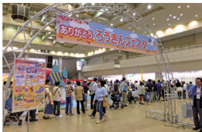
ありがとう「ろうきんフェスタ2014」 (金沢地区3店舗、金沢ライフサポートセンター共催)