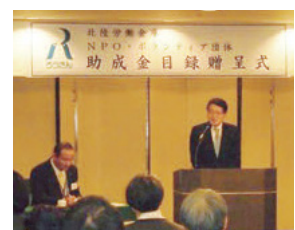
NPOボランティア団体助成金目録贈呈式