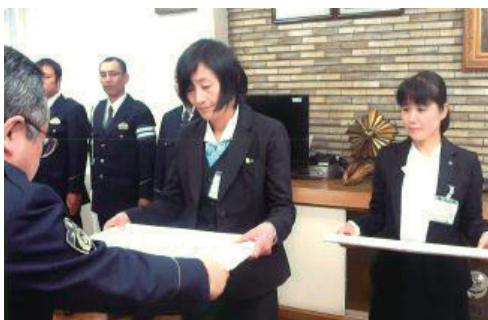
感謝状授与式の様子（勝山署） （2015年2月27日 福井新聞朝刊掲載）

今後も、より良質で安心できる<ろうきん>らしい商品・サービスをご提供するため「安心・健全・貢献」をモットーに一層の努力を続けてまいります。