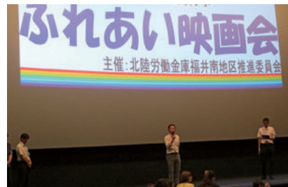
地域交流行事「チャリティふれあい映画鑑賞会」 (福井南支店)