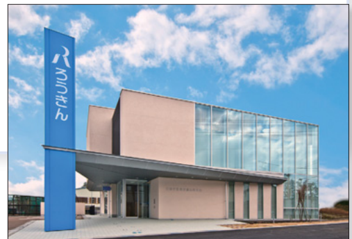
富山東支店 新店舗