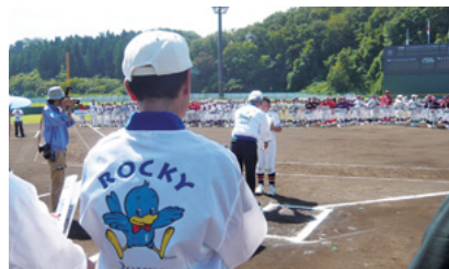
ろうきん杯福井県学童野球大会