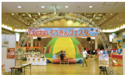
地域交流行事「ありがとうろうきんフェスタ2013」 (金沢地区3店舗、金沢ライフサポートセンター共催)