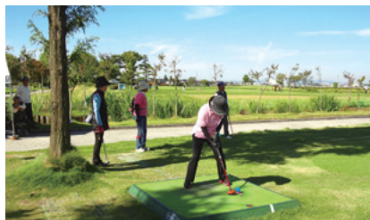
北陸ろうきんパークゴルフ富山県大会

また、全店舗での地域交流行事の開催を通じ寄せられた募金額は総額2,153,671円となり、各種団体に寄付を行うことで、地域福祉の向上に役立てられています。