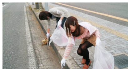
福井地区清掃活動の様子