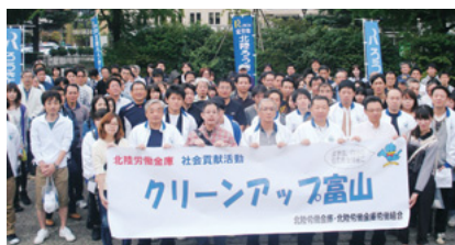
富山地区清掃活動の様子

日時／2013年10月5日(土) 内容／歩道清掃活動 場所／富山県庁前公園から神通川緑地公園 および環水公園