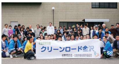
石川地区清掃活動の様子

日時／2013年10月5日(土) 内容／歩道清掃活動 場所／①金沢地区：本店を中心とした周辺部 ②能登地区：鹿島バイパス(七尾市下町 ～羽咋市四柳町)